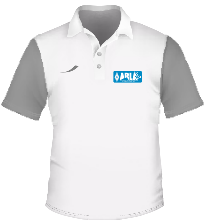
exemplo de vestuário