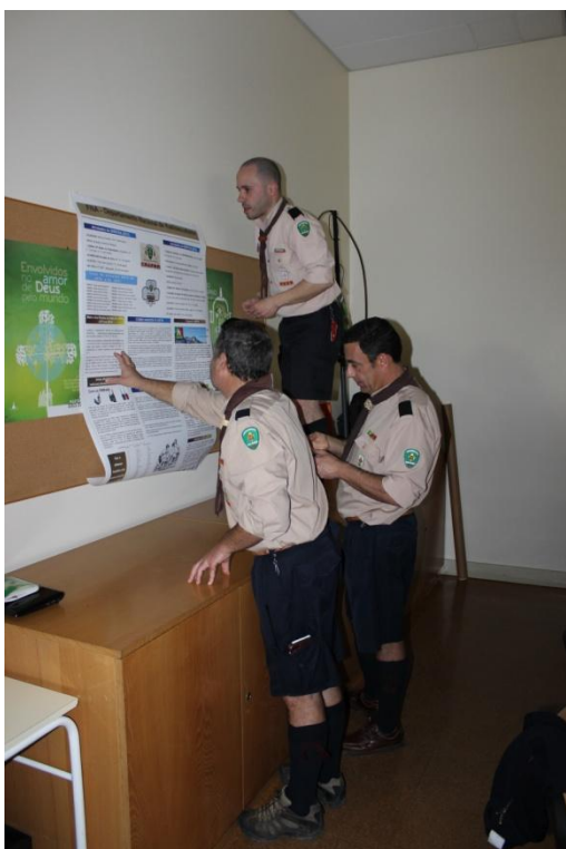
Conselho Nacional de Representantes

O Departamento Nacional de Radioescutismo da FNA, assim como alguns núcleos e associados, têm desenvolvido diversas atividades de Radioescutismo no presente ano. Durante o Conselho Nacional de Representantes, nos dias 15 e 16 de março, em Fátima, realizou-se uma ação de divulgação, tendo sido exposto um poster com diversos artigos de Radioescutismo e uma mostra de alguns equipamentos de rádio.